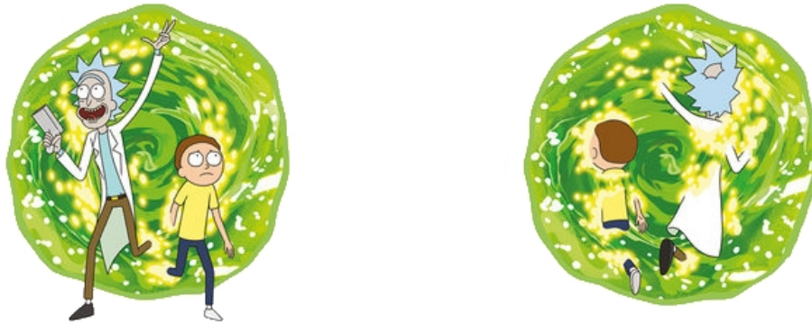
شکل ۱: ریک و مورتی در حال دورنوردی! عکس تزئینی است.

در این مثال سعی می‌کنیم یک پدیده غیربديهی و عجیب را بررسی کنیم: دورنوردی کوانتومی! ۱ دورنوردی کوانتومی [۱] روشی برای انتقال حالت کوانتومی بدون استفاده از لینک مخابراتی کوانتومی بین فرستنده و گیرنده است. دورنوردی