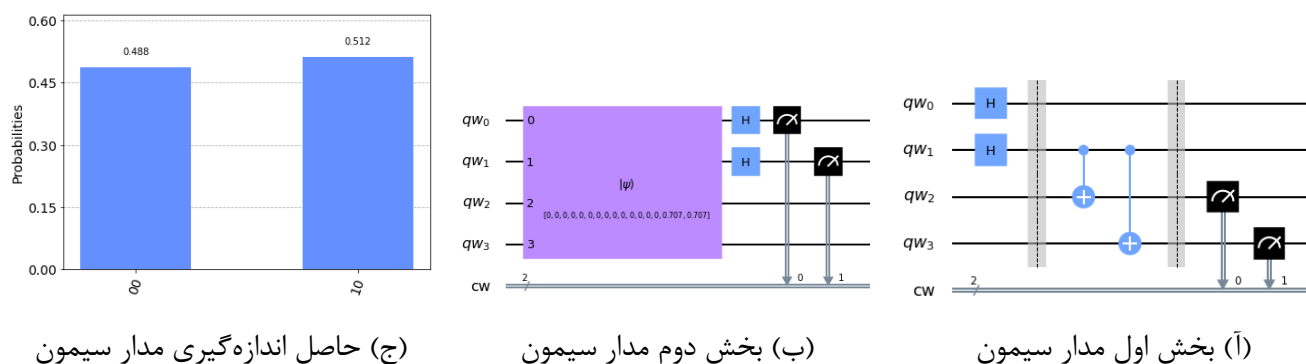
شکل ۳: بررسی مدار سیمون

cw = ClassicalRegister(n, name="cw") simon_circuit = QuantumCircuit(qw, cw) for i in range(n): simon_circuit.h(i) simon_circuit.barrier() simon_circuit.cx(1, 2) simon_circuit.cx(1, 3) simon_circuit.barrier() for i in range(n): simon_circuit.measure(i+n, i)